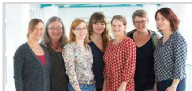
Die Mindelheimer Hebammen